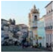
1 Historisches Zentrum von Salvador de Bahia (Brasilien) Historic Centre of Salvador de Bahia