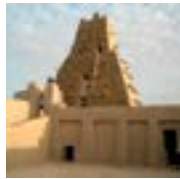
6 Timbuktu (Mali) Timbuktu