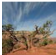
10 Grand Canyon Nationalpark (USA) Grand Canyon National Park