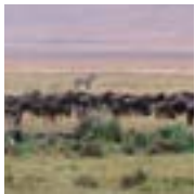
3 Serengeti Nationalpark (Tansania) Serengeti National Park