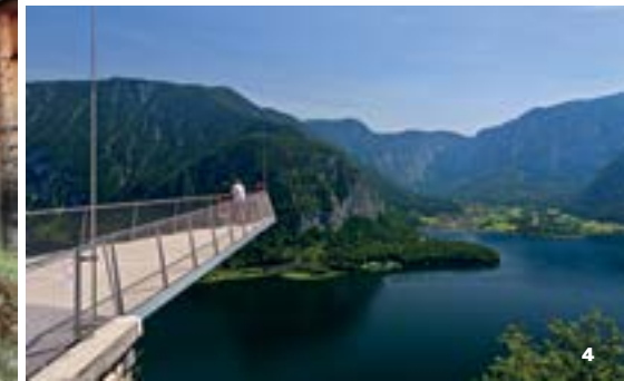
1, 2, 4 © Veronik Muntzmann 3 © OÖ Tourismus