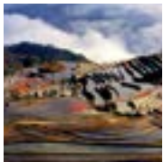
2 Kulturlandschaft von Honghe Hani Reisterrassen (China) Cultural Landscape of Honghe Hani Rice Terraces