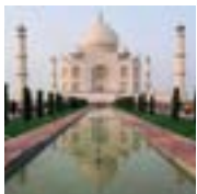
5 Taj Mahal (Indien) Taj Mahal