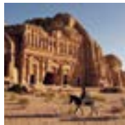
8 Petra (Jordanien) Petra